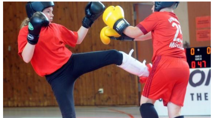
(Foto: Augsburgener Allgemeine - Von wegen Prügeltruppe: Die Kickboxabteilung des TSV Weißenhorn räumt mit gängigen Vorurteilen auf. – Andreas Brücken)

Alle waren hochmotiviert, und zeigten sich ehrgeizig in ihren Kämpfen. Teilweise waren die Ergebnisse sehr knapp, und einzelne Kämpfe haben den Athleten alles abverlangt.