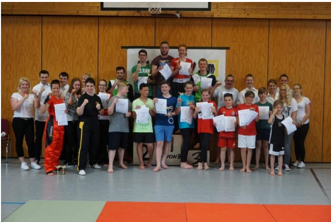
(alle Teilnehmer des internen Turniers – TSV Weissenhorn)

Auf diesem Weg, konnten sich die Angehörigen ein Bild davon machen, was und wie hier trainiert wird.